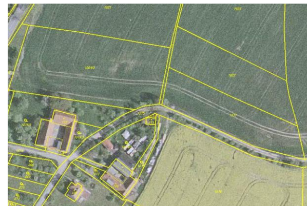
Ortofoto s obrazem katastrální mapy po obnově katastrálního operátu

Po skončení prací na obnově katastrálního operátu dochází k vyhlášení jeho platnosti. Podle § 58 odst. 2 vyhlášky č. 357/2013 Sb., katastrální vyhláška, zašle katastrální úřad sdělení o vyhlášení platnosti obnoveného katastrálního operátu obci, na jejímž území byl katastrální operát obnoven. Obec zveřejní tuto informaci v místě obvyklým způsobem. Katastrální úřad a Český úřad zeměměřický a katastrální zveřejní vyhlášení platnosti obnoveného katastrálního operátu rovněž na svých internetových stránkách.